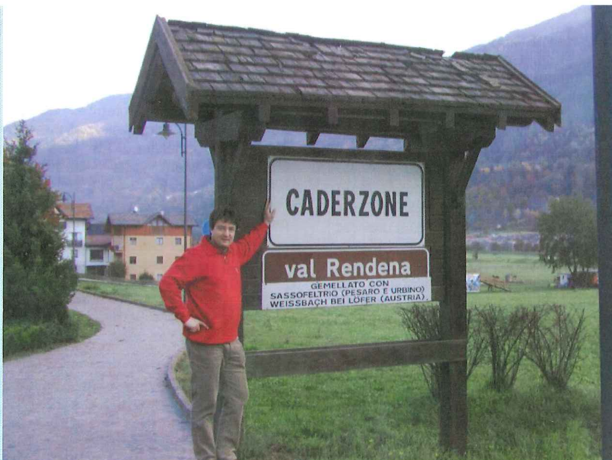
Besuch bei unserer Partnergemeinde „Caderzone – Trient – Italien“ im Herbst 2004