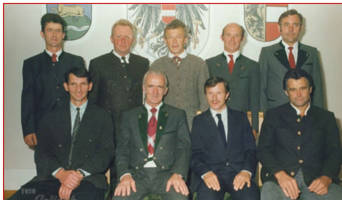
Gemeindevertretung von 1984-1989