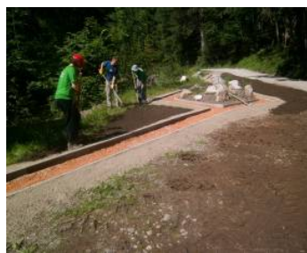
Barfußweg neu gestaltet