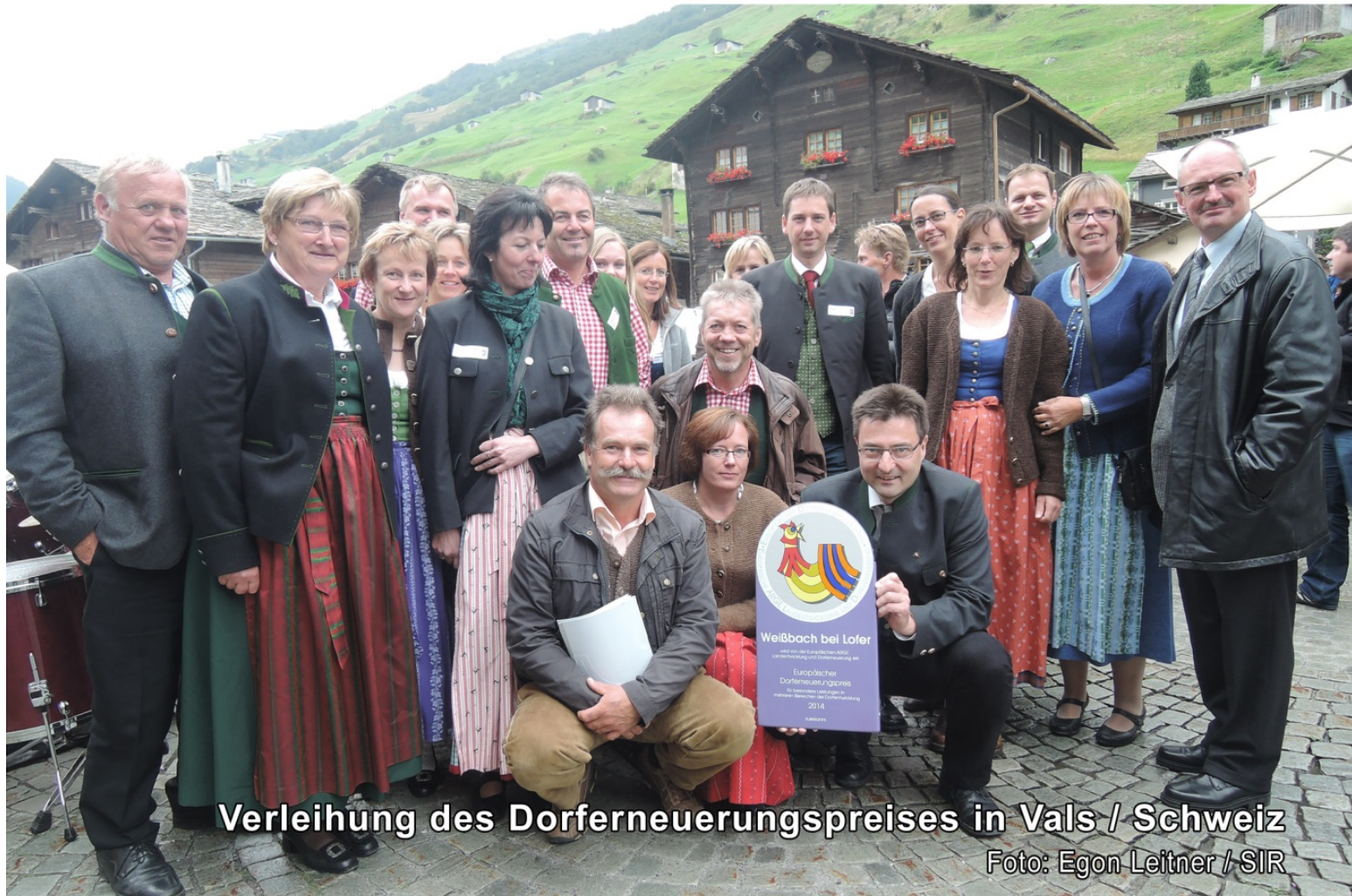
Verleihung des Dorferneuerungspreises in Vals / Schweiz