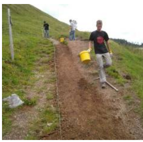
Aufwendiger Treppenbau bei Steilstücken des Almweges