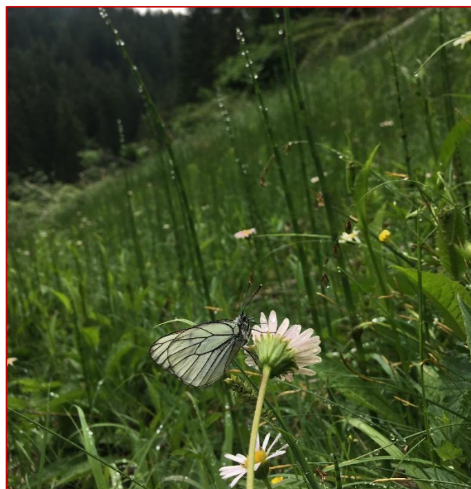
Der Baumweißling, ein Wildbestäuber

Wir würden uns freuen, viele Gäste und Einheimische demnächst bei einer der zahlreichen Veranstaltungen begrüßen zu dürfen und wünschen Euch in diesem Sinne einen schönen Sommer und bis bald im Naturpark Weißbach!