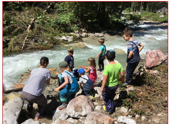
Die Kindergartenkinder bei der Waldwoche