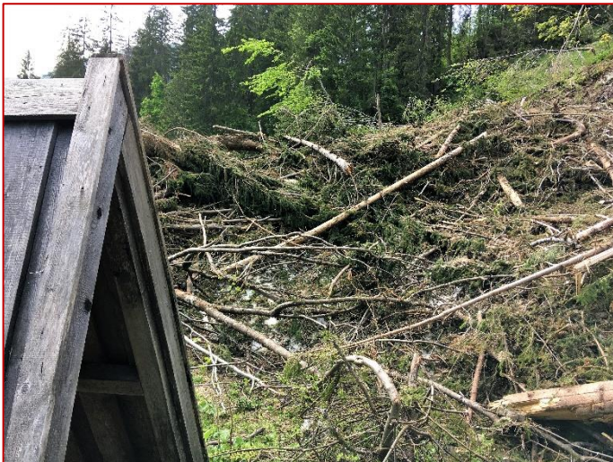
Lawinenschaden am Waldenweg

Auch wir haben mit einigen Schäden zu kämpfen – zum Beispiel wurde der beliebte „ Walden “ Weg von einer Lawine und zahlreichen abgebrochenen und umgestürzten Bäumen schwer getroffen. Es wird noch ein paar Tage dauern bis wieder alles hergerichtet ist. Für die aktuellen Bedingungen bitte einfach im Naturpark Infozentrum nachfragen.