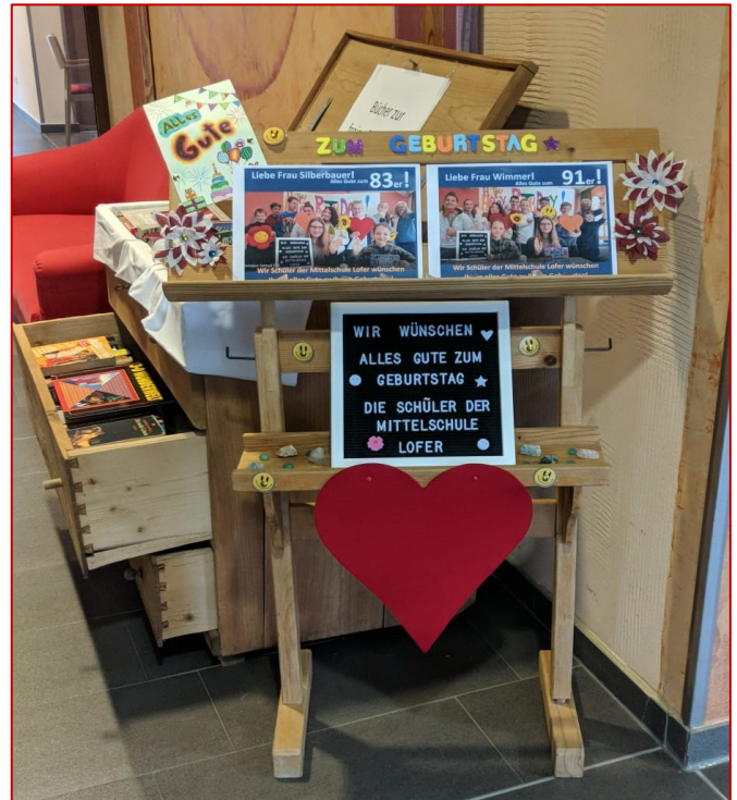
Die Geburtstagsgrüße aus der Mittelschule