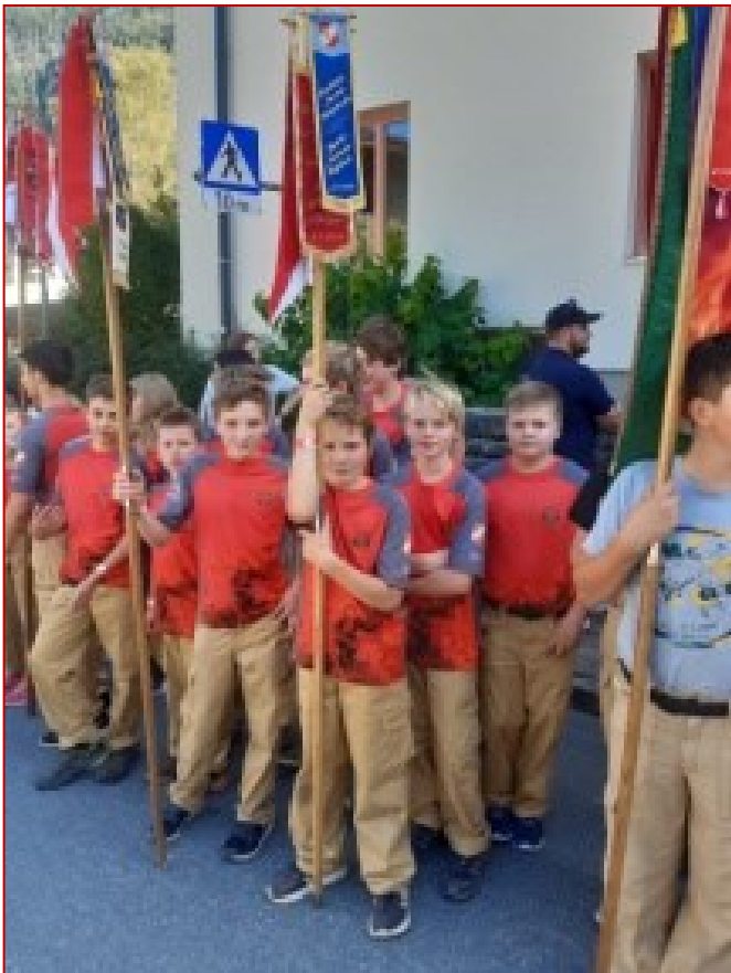
Die Feuerwehrjugend beim Wissenstest

Wir möchten uns vor Weihnachten bei der Bevölkerung und vor allem bei den unterstützenden Mitgliedern von der FF Weißbach für die Unterstützung im vergangenen Jahr bedanken.